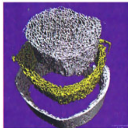
Explosionsansicht des Schienbeinknochens

Das Xtreme-CT ermöglicht einen umfassenden Einblick in die Knochenstruktur. Bislang sind in Deutschland lediglich drei dieser Geräte im Einsatz.