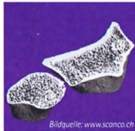
Mikroarchitektur von Radius und Ulna

vidualisiertes, mikroarchitektonisches Bild einer Knochenbildungsstörung. Möglich ist dies deshalb, weil der Knochen nicht nur sichtbar gemacht wird, sondern an jeder Knochenstelle fünf Dichtemessungen vorgenommen werden. Auf diese Weise können wir z. B. sehen, ob die Rinde oder die innere Schicht betroffen ist. Dies wiederum lässt Rückschlüsse auf die Ursache der